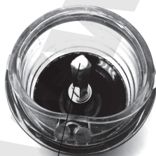
Ось стакана для специй