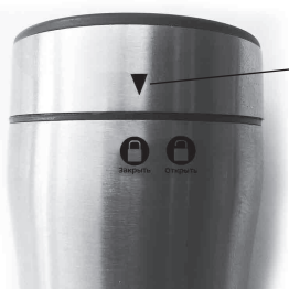
Указатель положения крышки