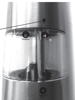
Указатель положения моторного блока